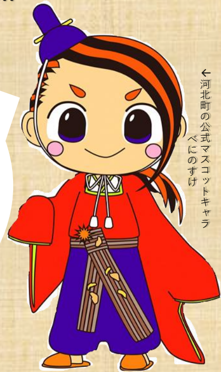
←河北町の公式マスコットキャラ べにのすけ